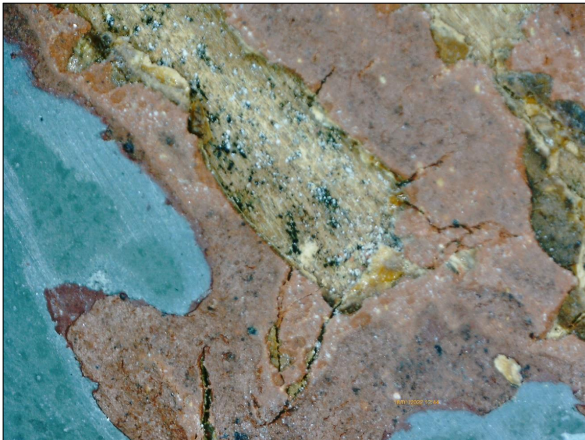
Dřevo, lak (s fragmenty černých lesklých depozitů), bílá vrstva, lak, červená, šedá a recentní světle šedá barevná vrstva