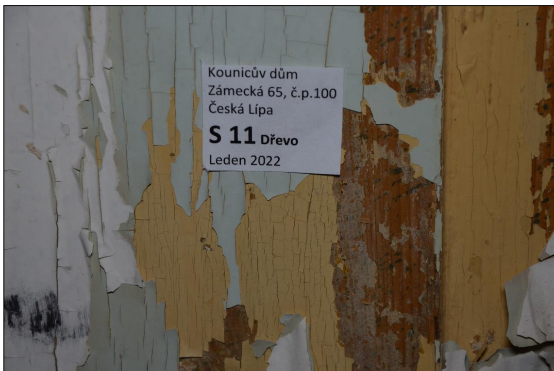
Zárubeň dveří: dřevo, lak, fládr (se zřejmě druhotnými barevnými stříkanci), bílý, okrový a recentní světle zelený nátěr (mladší nátěry zřejmě syntetické)