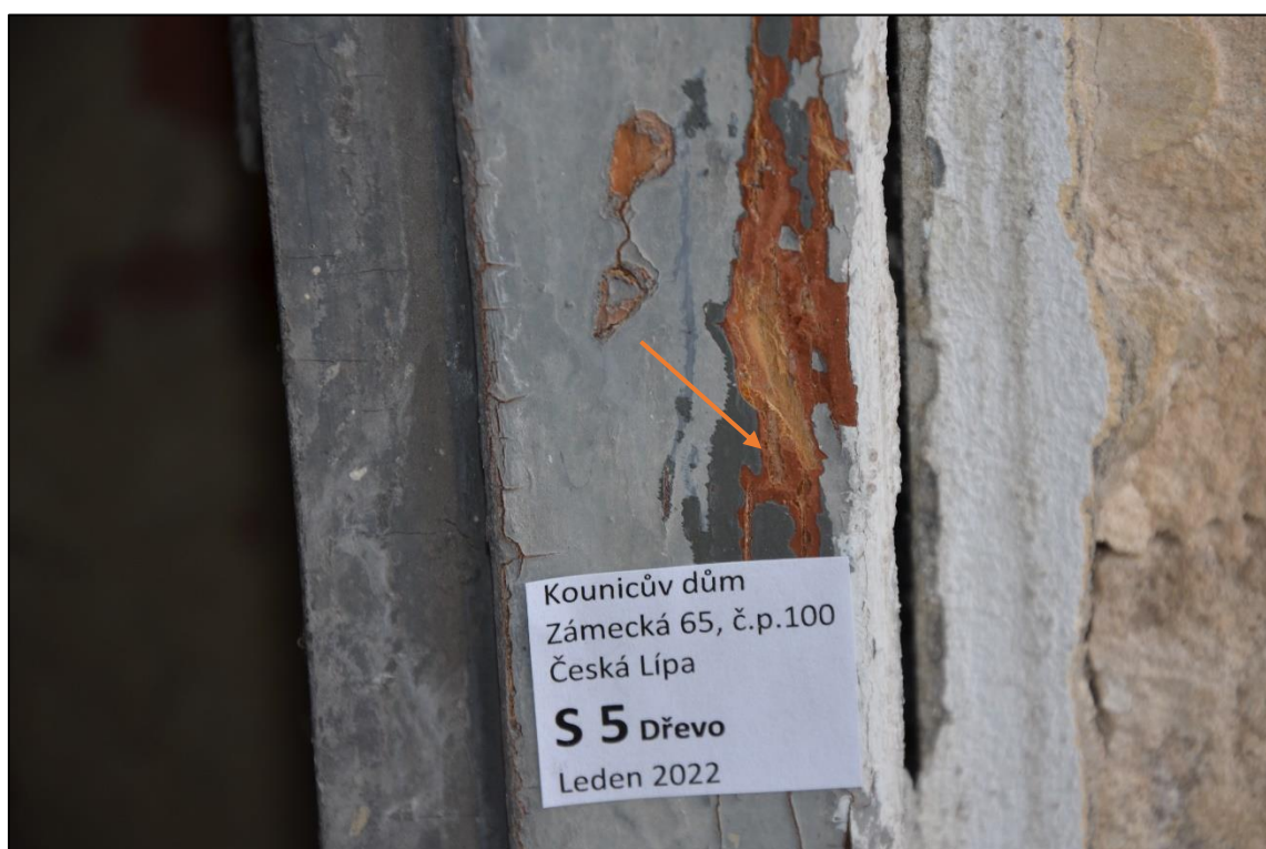
Stratigrafická sonda na dveřích do severozápadního dvora. Šipka označuje místo pořízení snímku digitálním mikroskopem.