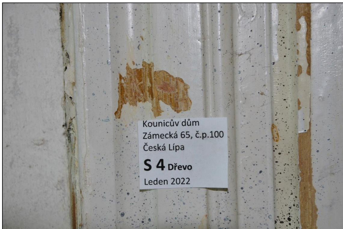
Dřevěná zárubeň dveří. Na nejstarší vrstvě světlý fládr, následuje bílý, okrový a recentní bílý nátěr