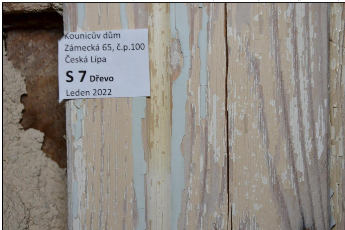
Zárubeň dveří: dřevo, vápenný nebo hlinkový nátěr bílé barevnosti, bílý nátěr, okrový syntet. nátěr, světle modrý syntet. nátěr