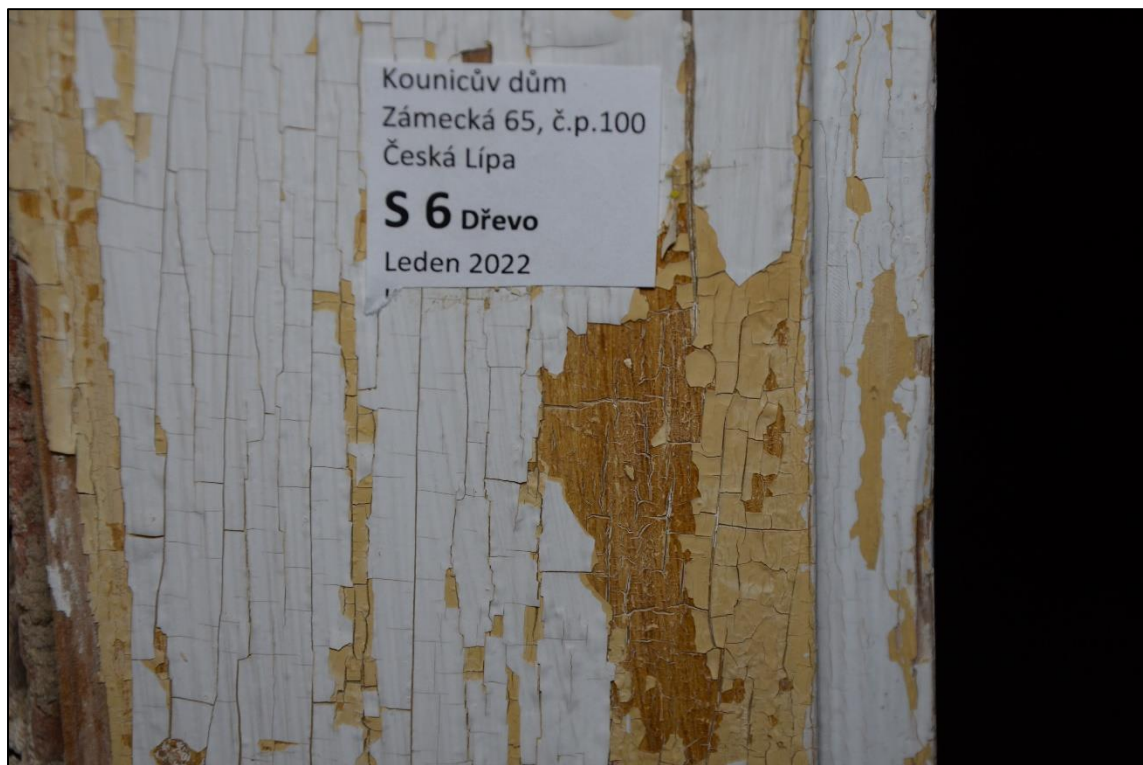
Zárubeň dveří: dřevo, světlý fládr, okrová a recentní bílá barevnost