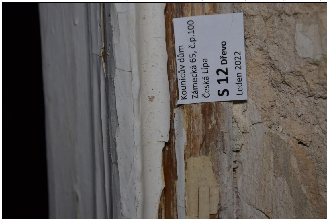
Zárubeň dveří: dřevo, lak, světle šedý vápenný nebo hlinkový nátěr, bílý, okrový a recentní bílý nátěr (mladší nátěry zřejmě syntetické)