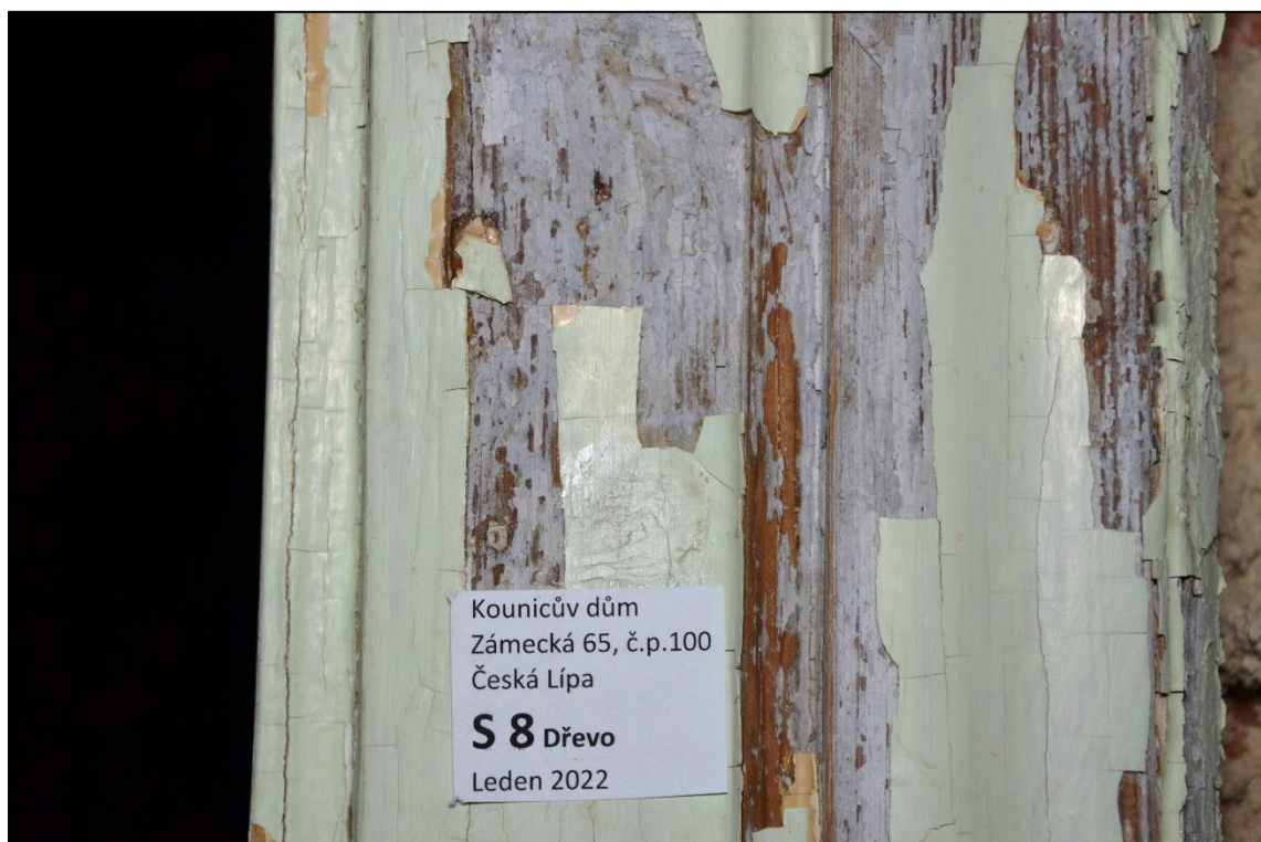
Zárubeň dveří: dřevo, lak, světle šedý vápenný nebo hlinkový nátěr, bílý, okrový a recentní světle zelený nátěr (mladší nátěry zřejmě syntetické)