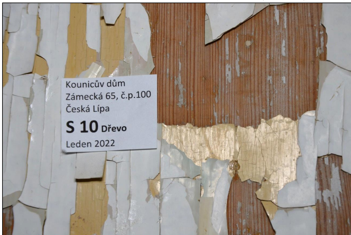
Zárubeň dveří: dřevo, lak, světle šedý vápenný nebo hlinkový nátěr, bílý, okrový a recentní světle zelený nátěr (mladší nátěry zřejmě syntetické)